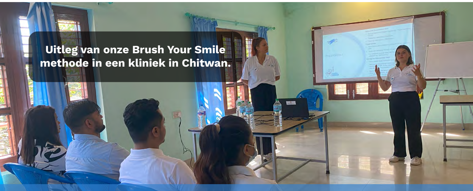
Uitleg van onze Brush Your Smile methode in een kliniek in Chitwan.

In een presentatie introduceerden we de BYS-methode aan de tandartsen en mondhygiënisten van de kliniek. Ook was er een delegatie aanwezig uit het district Baglung waar Stichting Medora ook actief is. De methode werd door iedereen enthousiast ontvangen. Daarna bezochten we de Jhuwani Secondary School om onze methode te demonstreren. Het idee was: we doen het een keer voor, en daarna nemen zij het over, volgens ons Teach the teacher principe.