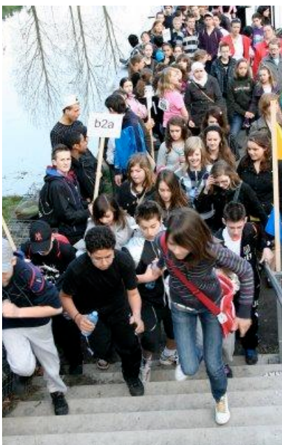
>de bovenbouw gaat van start